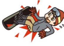
●スポーツ中のケガ