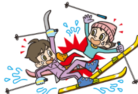
●スキー中、他人にぶつかりケガをさせてしまった。