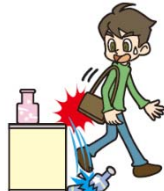
●買い物中、誤って商品を壊してしまった。

国内・国外を問わず、日常生活上の偶然な事故により、他人のものを壊したり、他人にケガをさせたりして法律上の損害賠償責任を負った場合に補償します。(示談交渉サービスつき)