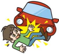
●交通事故によるケガ

国内・国外を問わず、交通事故はもちろん、ガス爆発・建物火災によるケガ、工作中・スポーツ中・旅行中など家庭内外の日常生活におけるケガを補償します。