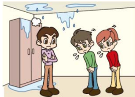
●水漏れを起こし、階下のお宅を汚した。