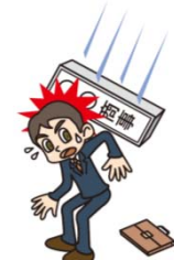
●お工作中的のケガ