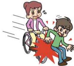
●自転車に乗っていて他人にケガをさせた。

(注)上記事例でも、事故状況等により、法律上の損害賠償責任が発生しない場合は、保険金のお支払対象となりませんのでご注意ください。